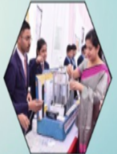
Science Mela Exhibition Group & Individual Event

Nehru Yuva Kendra - KADAPA "YUVA UTSAV -2024" Participant Registration Form : https://forms.gle/h1faMTSLvc9oEKBq7 Cell : 91776 16677 E-mail : dyc.kadapa@gmail.com