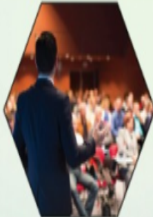
Declamation Contest (Elocution)