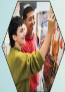
Young Artists Painting