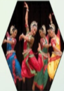
Cultural Fest Group