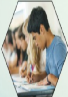
Young Writers Poetry · Essay Writing